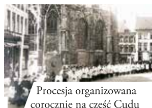
Procesja organizowana corocznie na cześć Cudu