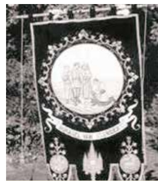
Sztandar przedstawiający odnalezienie cudownej Hostii