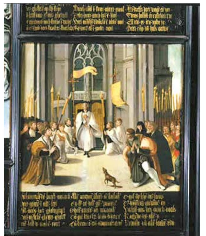
Relikwia Cudownej Hostii niesiona w procesji (1535), Święte Muzeum w Bredzie