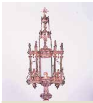
Kunstowna Monstrancja, w której podczas procesji niesiona była cudowna Hostia, Breda