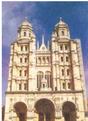
Bazylika Świętego Michała, Dijon