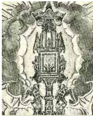
Relikwiarz zawierający Świętą Hostię, dar księżnej Izabelii z 1454 roku