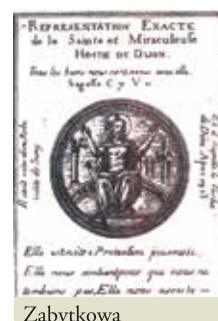
Zabytkowa reprodukcja Świętej Hostii z Cudu w Dijon