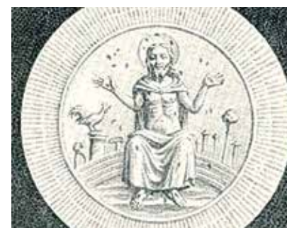
Dijon, Hostia przekazana w 1433 roku przez Papieża Eugeniusza IV księciu Burgundii, Filipowi

zdecydował się przekazać cudowną Hostię księciu Burgundii, Filipowi, który następnie podarował ją miastu Dijon. Wiemy z całą pewnością, że w roku 1794, cudowna Hostia znajdowała się nadal w Bazylice Świętego Michała Archanioła, lecz w dniu 9 lutego 1794 roku, władze miasta Dijon przejęły ten kościół i zdecydowały się zamienić go w świątynię «la Raison», tj. „bogini Rozumu”. Cudowną Hostię spalono. Zachowały się liczne dokumenty i dzieła sztuki ilustrujące Cud, w tym na przykład jeden z witraży katedry w Dijon, na którym przedstawiona jest najważniejsza scena Cudu.