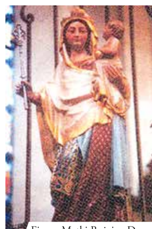
Figura Matki Bożej w Douai