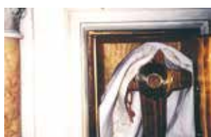
Tabernakulum, w którym przechowywana jest Cudowna Hostia