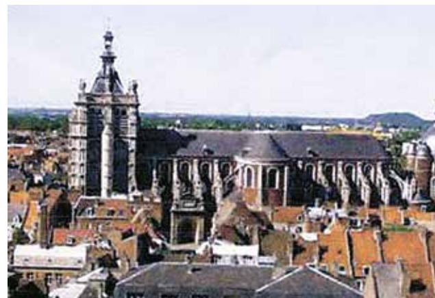
Zewnętrzna fasada kościoła Świętego Piotra w Douai