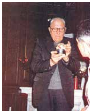
Rok 1975 Proboszcz kościoła Świętego Piotra pokazuje Hostię z 1254 roku