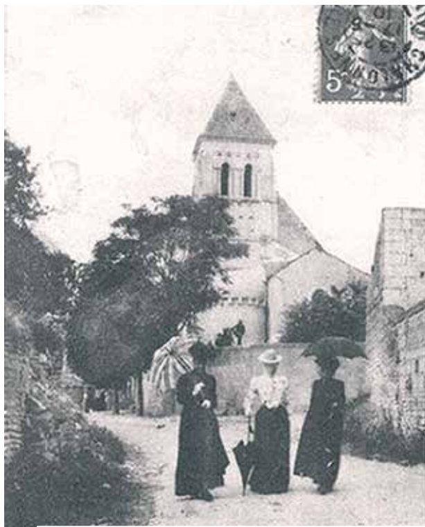
Kościół parafialny w Les Ulmes