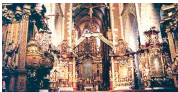
Wnętrze Kościoła Bożego Ciała, Kraków