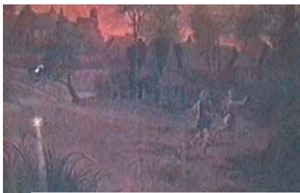
Obraz, który znajduje się w Kościele Bożego Ciała w Krakowie, na którym przedstawione jest zjawisko świetlistych promieni, pochodzących z mokradel