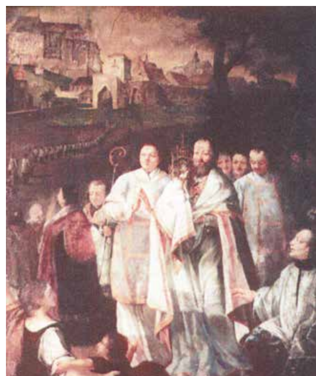
Na tym obrazie przedstawiona jest procesja Biskupa i mieszkańców po odnalezieniu Cudownych Hostii w mokradle

promieniejące mokradła w procesji, której przewodniczył sam Biskup. Poszukiwania objęły cały teren i, w końcu, pewien człowiek odnalazł cyborium z Hostiami, które były całkowicie nienaruszone i emanowały oślepiającym blaskiem. Wzruszona ludność rozpoczęła chwalić Pana i świętować Cud. Po dziś dzień, każdego roku z okazji święta Bożego Ciała, Cud jest upamiętniany w kościele Bożego Ciała w Krakowie. Ówczesny król Polski, Kazimierz III Wielki, wydał rozkaz, by na cześć Cudu wzniesić kościół pod wezwaniem Bożego Ciała.