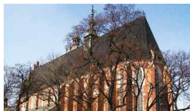
Kościół Bożego Ciała, Kraków

W 1345 roku, kilku złodziei ukradło z kościoła położonego niedaleko Krakowa, cyborium, zawierające konsekrowane Hostie. Sprawcy bardzo szybko zorientowali się, że cyborium nie było wykonane z prawdziwego złota, więc wyrzucili je do mokradł pełnych śmieci i błota. Wówczas na mokradłach pojawiło się bardzo silne światło, które pochodziło z błota. Jasność trwała przez całą noc i dzień przez kilka dni. Wszyscy mieszkańcy zauważyli to niezwykle zjawisko i podjęto decyzję o powiadomieniu o nim Biskupa Krakowa. Prałat nie mógł zrozumieć, w jaki sposób z mokradł uwalniają się tak jasne promienie światła, że widać je z odległości kilku kilometrów, zarządził zatem trzy dni postu i modlitwy. Trzeciego dnia, mieszkańcy miasteczka udali się na