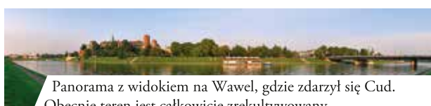
Panorama z widokiem na Wawel, gdzie zdarzył się Cud. Obecnie teren jest całkowicie zrekultywowany