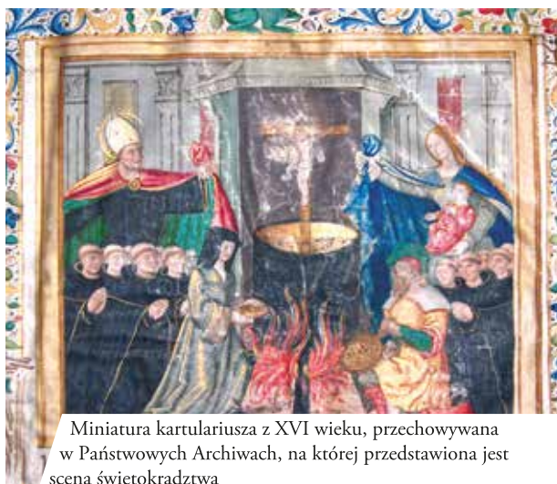
Miniatura kartulariusza z XVI wieku, przechowywana w Państwowych Archiwach, na której przedstawiona jest scena świętokradztwa