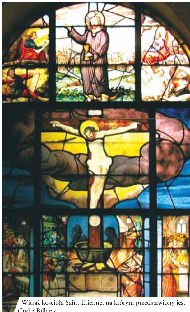
Witraż kościoła Saint Etienne, na którym przedstawiony jest Cud z Billetes