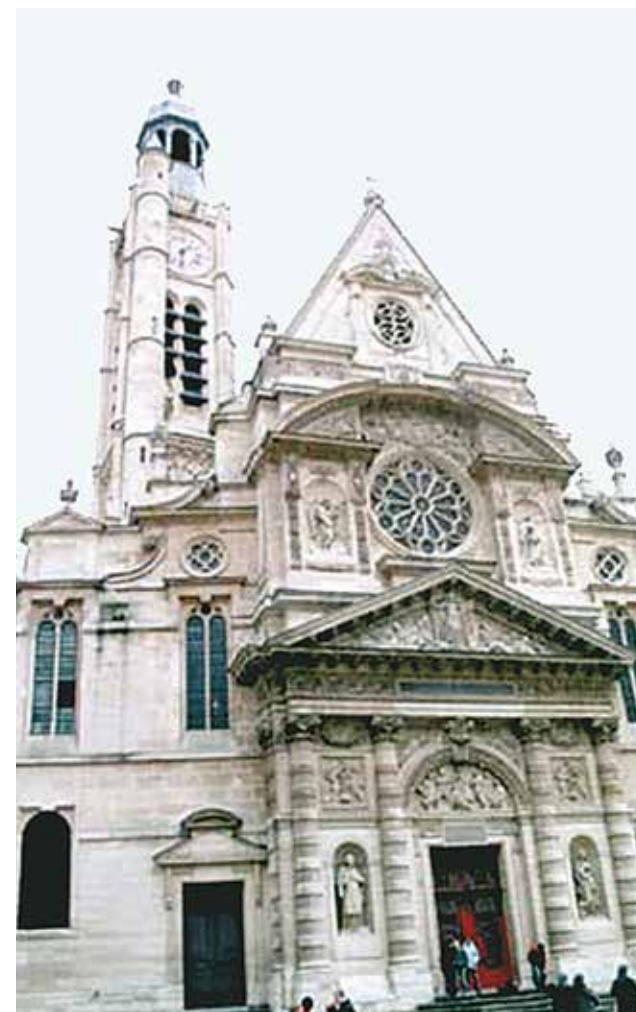
Kościół Saint Etienne du mont