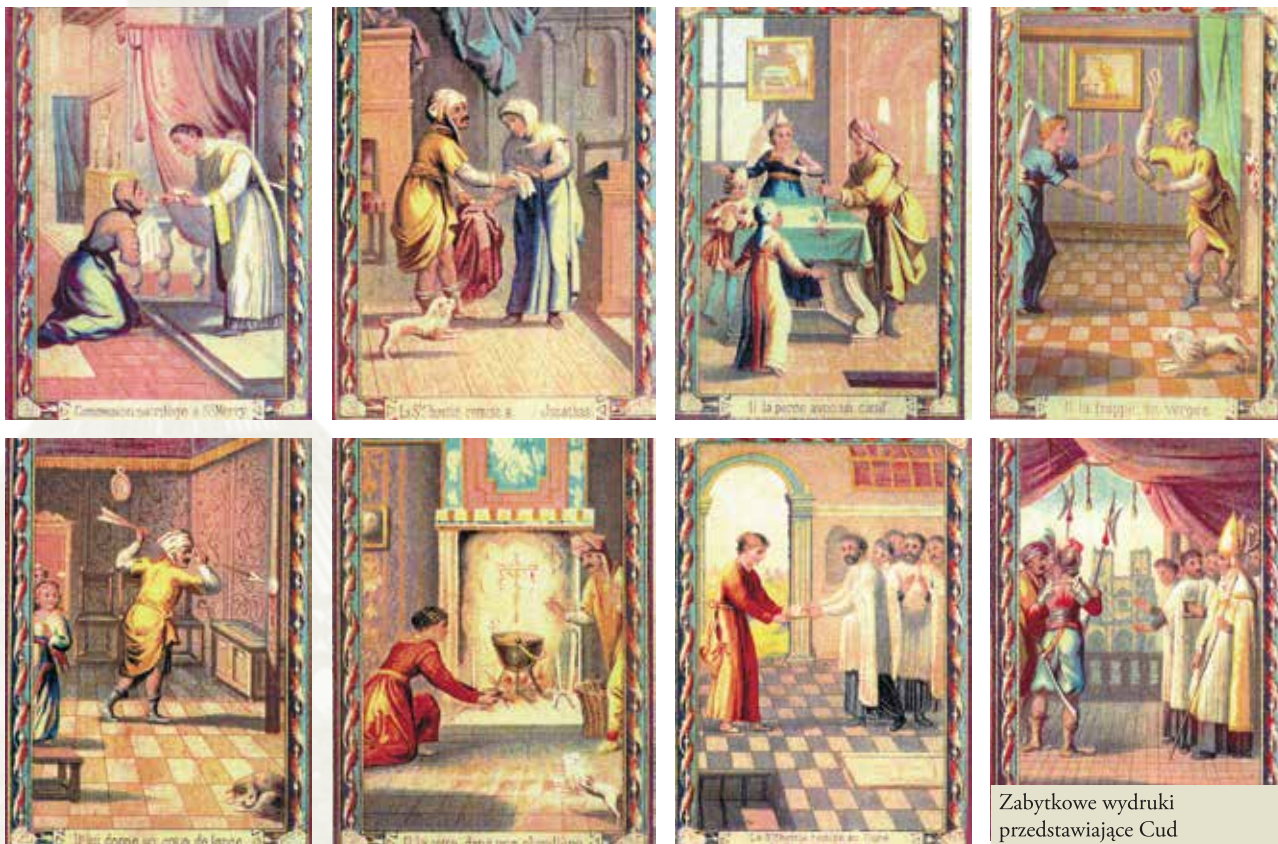
Zabytkowe wydruki przedstawiające Cud