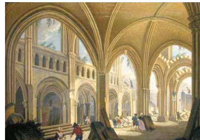
Zburzenie kościoła Saint-Jean-en-Grève. Pierre-Antoine Demachy (1797)