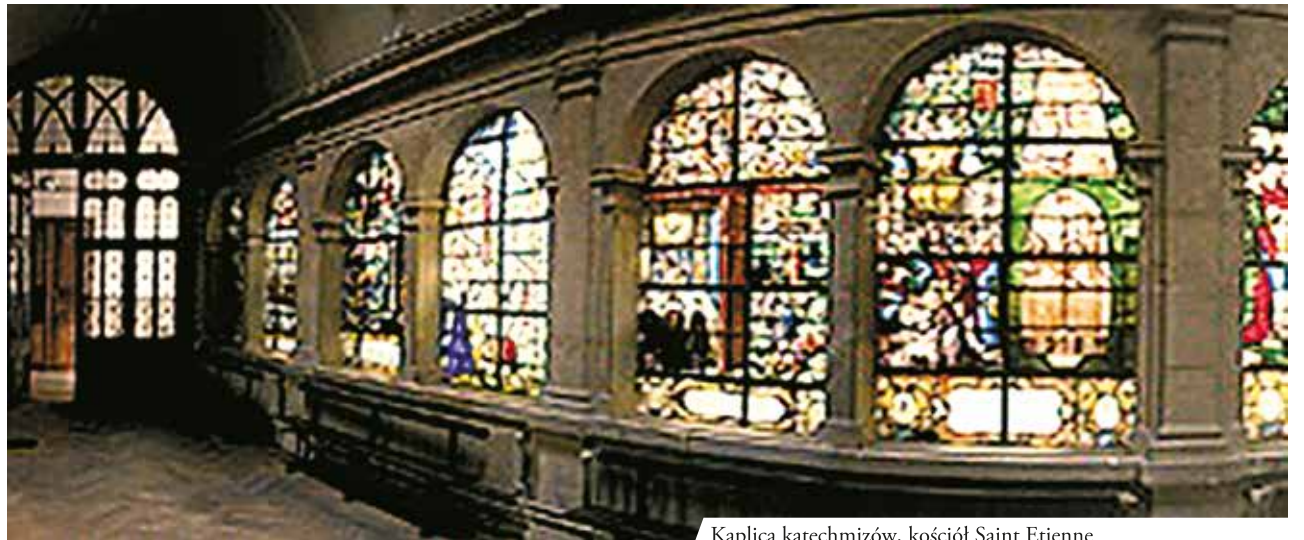
Kaplica katechizów, kościół Saint Etienne