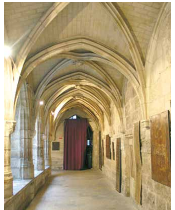
Klasztor des Billettes przekształcony obecnie w kościół protestancki